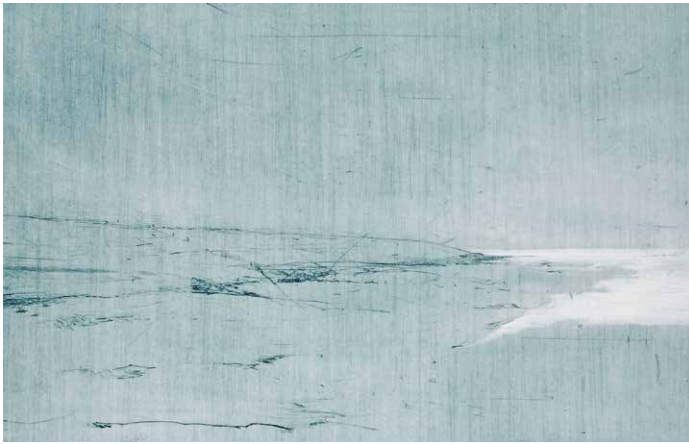
Otto Beckmann, Wasserland, 1995